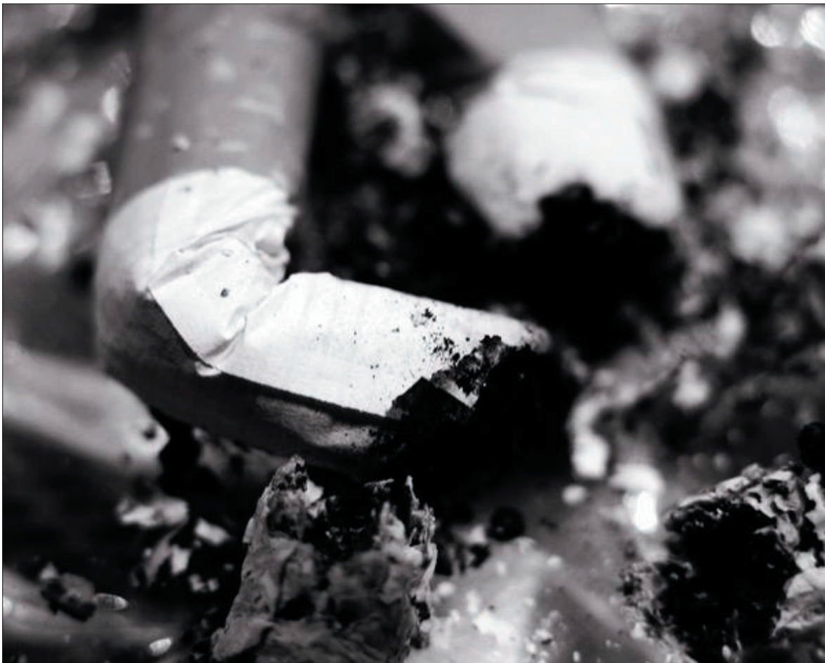
Auch optisch nicht gerade ansprechend: Zigaretten nach dem Gebrauch.